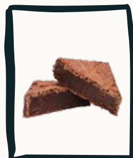
LE BROWNIE Au chocolat & noisettes

56€ le gâteau de 8 parts uniquement (commande 48h à l'avance maximum) La disponibilité de certains gâteaux variera en fonction des stocks