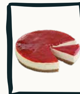
LE CHEESE CAKE CITRON Coulis de fruits rouge