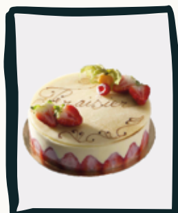
LE FRAISIER (saison estivale)

Retrouvez plus d'informations sur les descriptions et les allergènes dans notre catalogue de gâteaux.