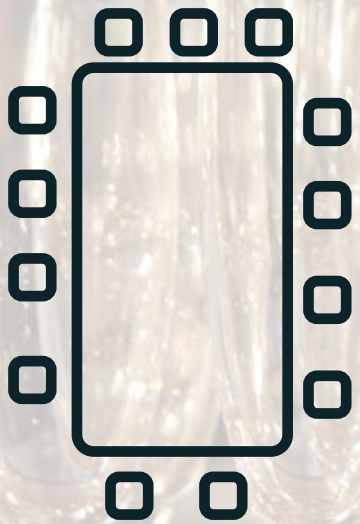
Grandes tablées dans la salle principale