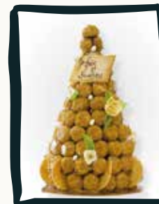
LA PIÈCE MONTÉE

9€ par personne - 3 choux par personne parfums au choix : Vanille, Chocolat, Café, Caramel