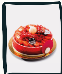
LE SUPRÊME FRAMBOISE