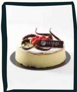
LA FRAMBOISE DES NEIGES

À partager avec 8 personnes pour 60€. Gâteaux 7,5€ la part à partir de 4 personnes (commande 48h à l'avance maximum)