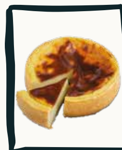
LE FLAN Pâtissier à la vanille