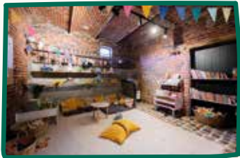
Salle de jeux enfant