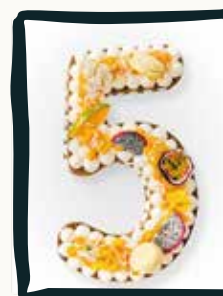
LE NUMBER CAKE

Parfums en assortiment : Caramel, Pistache, Vanille, Framboise, Chocolat, Citron