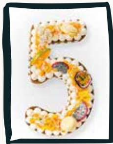
LE NUMBER CAKE

Parfums en assortiment : Caramel, Pistache, Vanille, Framboise, Chocolat, Citron