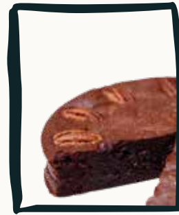
LE BROWNIE Au chocolat & noisettes

56€ le gâteau de 8 parts uniquement (commande 48h à l'avance maximum) La disponibilité de certains gâteaux variera en fonction des stocks