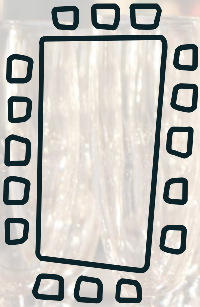
Grandes tablées dans la salle principale