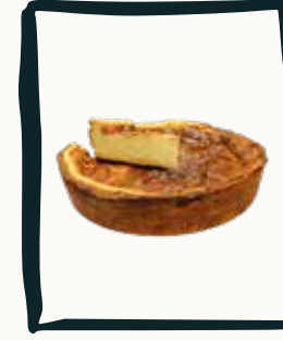
LE FLAN Pâtissier à la vanille