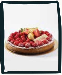
LE FRANGIPANE FRAMBOISE