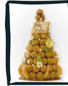
LA PIÈCE MONTÉE

9€ par personne - 3 choux par personne parfums au choix : Vanille, Chocolat, Café, Caramel