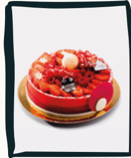
LE SUPRÊME FRAMBOISE