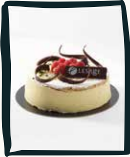
LA FRAMBOISE DES NEIGES

À partager avec 8 personnes pour 60€. Gâteaux 7,5€ la part à partir de 4 personnes (commande 48h à l'avance maximum)