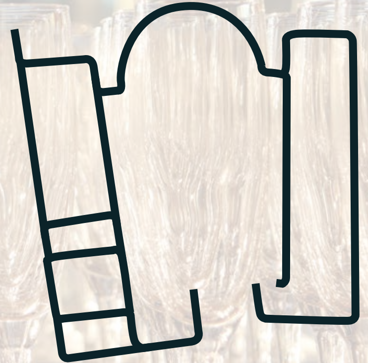
Privatisation totale de l'estaminet