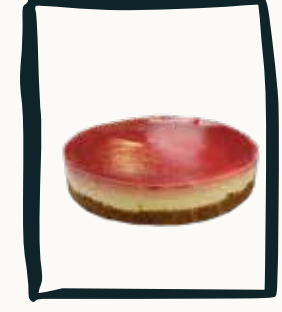
LE CHEESE CAKE CITRON Coulis de fruits rouge