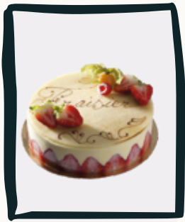
LE FRAISIER (saison estivale)

Retrouvez plus d'informations sur les descriptions et les allergènes dans notre catalogue de gâteaux.