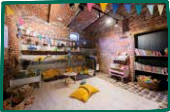
Salle de jeux enfant