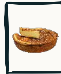
LE FLAN Pâtissier à la vanille