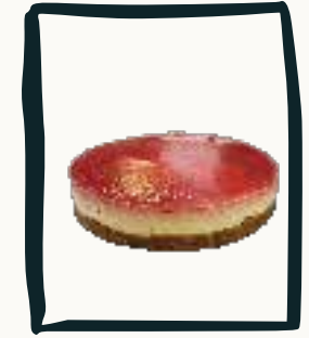
LE CHEESE CAKE CITRON Coulis de fruits rouge