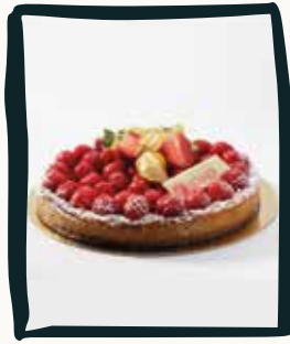
LE FRANGIPANE FRAMBOISE