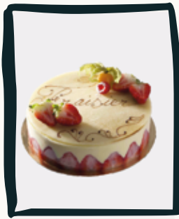
LE FRAISIER (saison estivale)

Retrouvez plus d'informations sur les descriptions et les allergènes dans notre catalogue de gâteaux.