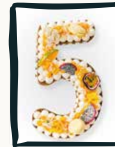
LE NUMBER CAKE

Parfums en assortiment : Caramel, Pistache, Vanille, Framboise, Chocolat, Citron