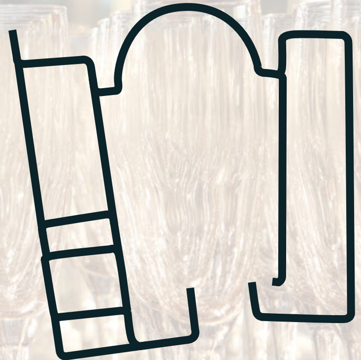
Privatisation totale de l'estaminet