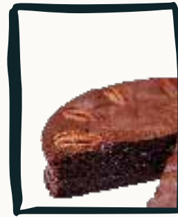
LE BROWNIE Au chocolat & noisettes

56€ le gâteau de 8 parts uniquement (commande 48h à l'avance maximum) La disponibilité de certains gâteaux variera en fonction des stocks