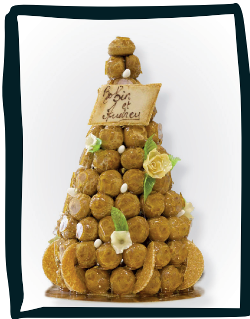
LA PIÈCE MONTÉE