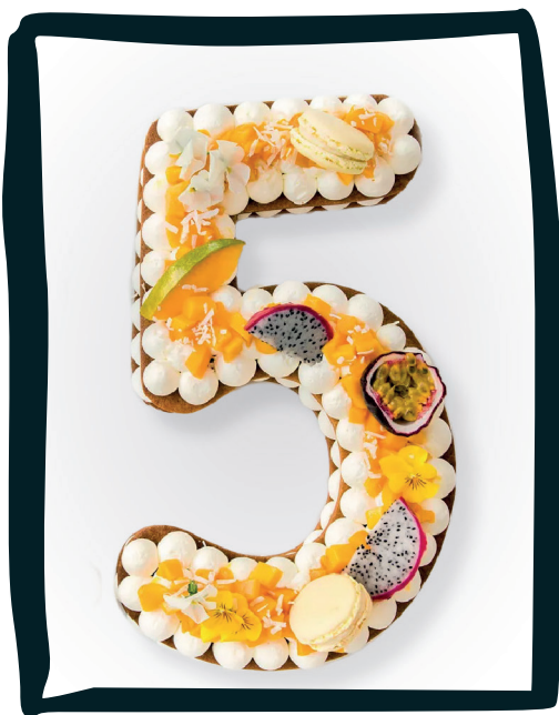
LE NUMBER CAKE